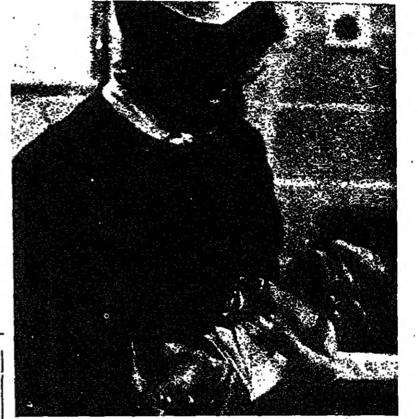
اجتهد الدكتور هينس في تطوير طريقة ازالة الضغط الداخلي بواسطة ساعة مثبتة على الكيس .

وبغية تجنب الازعاجات التي ترافق عادة عملية الوضع عدت بعض النساء - وبعدهن في تزايد من يوم الى اخر - في السنوات الاخيرة الى دراسة اساليب النفس والنهارين المعروفة بطريقة (الامتاز) للولادة الطبيعية . والان فان طريقة اخرى جديدة تبشر ، على الرغم من الجهد المتفاني المأتمن حولها ، بإزالة الام المصاحب للوضع دون استخدام الملقطس او التمارين . وتعرف الطريقة بطريقة ازالة الضغط الداخلي .